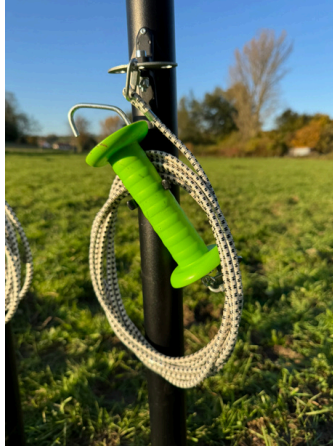
Schritt 4: Torgriff mit Litze entnehmen aus Aufbewahrungsklammer