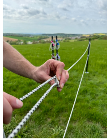
Schritt 5: Mit LuckyLitze-8 auf Länge bringen