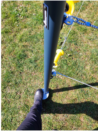
Schritt 1: Große Auftrittsplatte